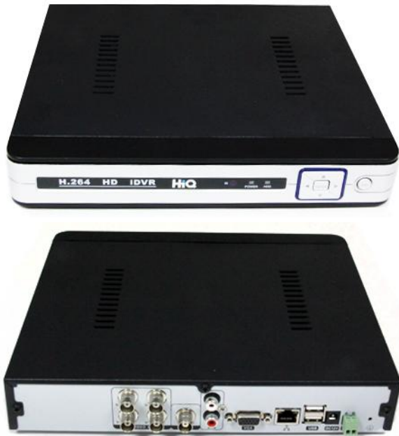
Фото регистратора и задней панели